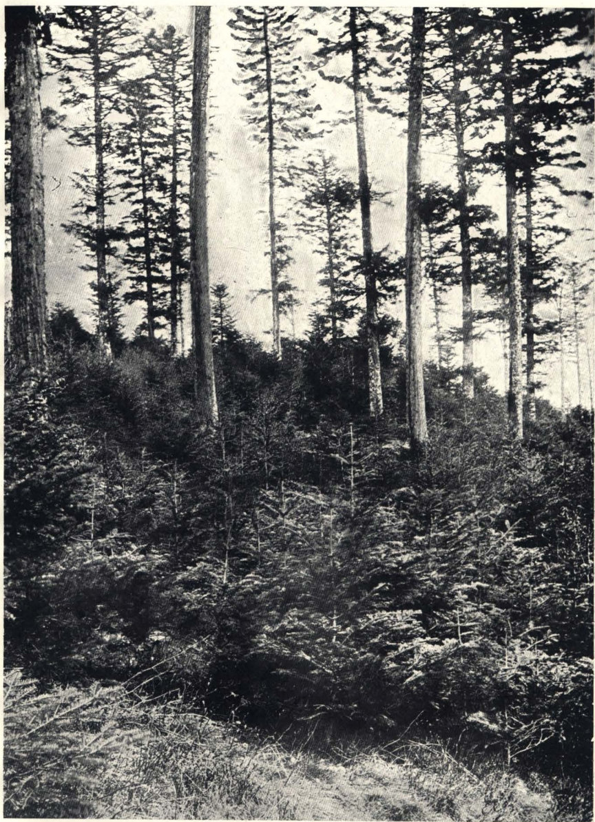
Jegenyefenyves természetes felújítása.

(Wolfsboden, Schwarzwald. — Kaán K. felvétele.)