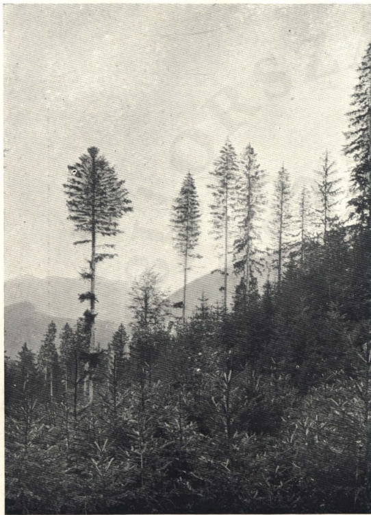
Luczfenyves természetes felújítása.

(St. Blasien, Schwarzwald.)