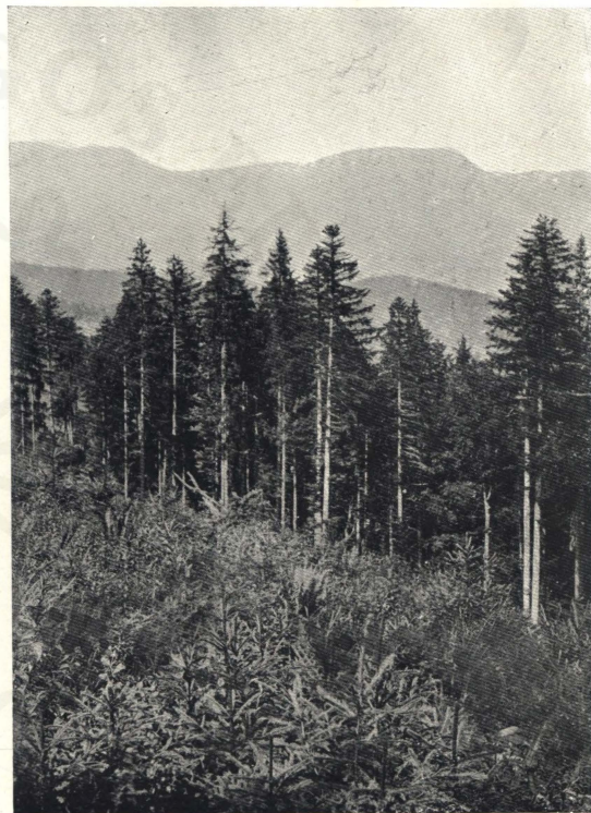
Lucz-, jegenye- és vörösfenyő-állab természetes felújítása.

(St. Blasien, Schwarzwald.)